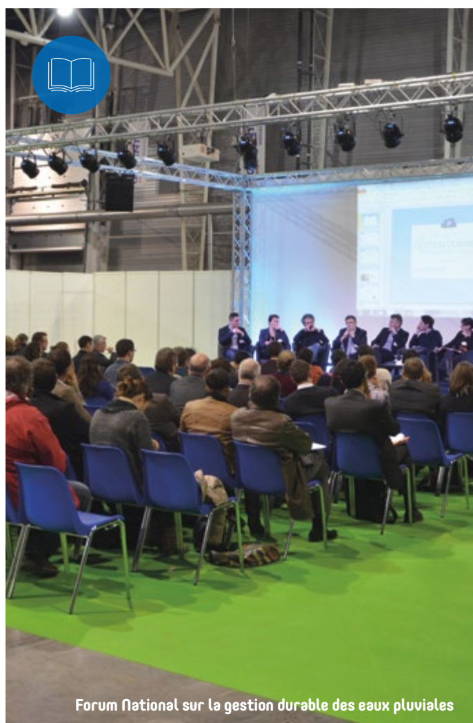
Forum National sur la gestion durable des eaux pluviales