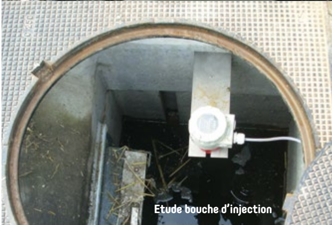
Etude bouche d'injection