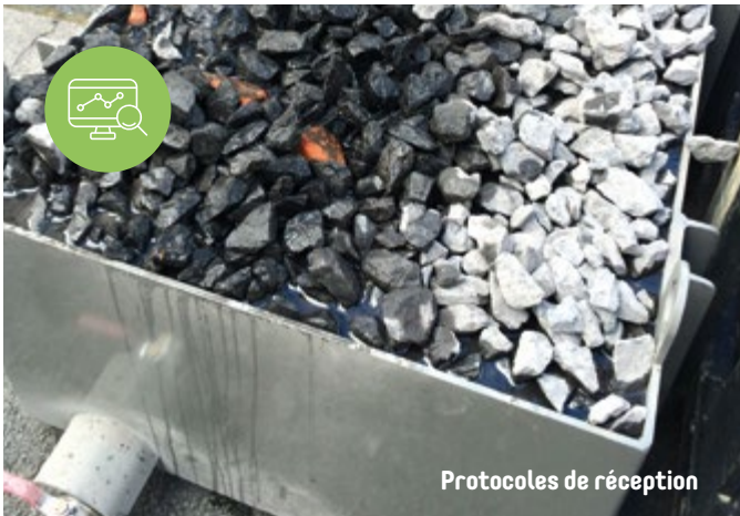
Protocoles de réception